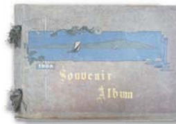
▲ 神戸高等商業学校第2回卒業アルバム 1908（明治41）年