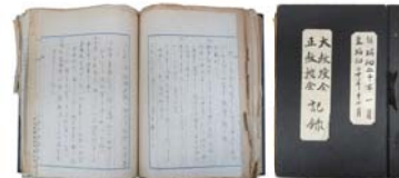
▲ 神戸経済大学の教授会記録 1945（昭和20）年