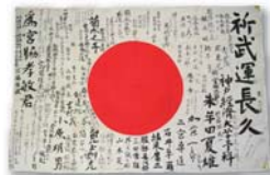
▲ 戦時下の学徒出陣の寄書き 1945（昭和20）年