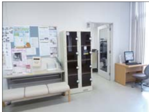
▲ 大学文書史料室の閲覧室入口