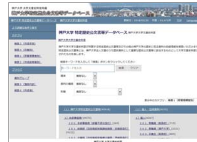
▲ 神戸大学特定歴史公文書等データベース https://lib.kobe-u.ac.jp/archives/db

大学文書史料室が所蔵する「特定歴史公文書等その他神戸大学の歴史に係る資料」は、汚れの除去、補修、目録入力等の整理が終了したことから、順次、目録情報をインターネット上で公開しています。最新の目録情報は、ホームページ掲載の「神戸大学特定歴史公文書等データベース」からご覧いただけます。また閲覧室には冊子目録も備えています。なお、現在、所蔵史料のデジタル化を進めており、デジタル画像の一部は、ホームページ掲載の「大学文書史料室デジタル・アーカイブ」からご覧いただけますので、ぜひご利用ください（前記「神戸大学特定歴史公文書等データベース」からも閲覧可）。