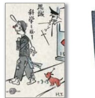
▲ 神戸経済大学予科の記念祭絵はがき 1946（昭和21）年