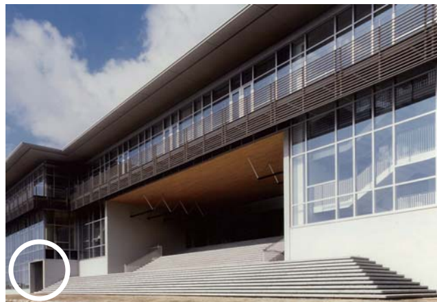
▲ 神戸大学百年記念館（1階の○印の場所に大学文書史料室があります）