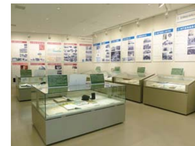
▲ 常設展「神戸大学史展」（展示ホールにて開催）

神戸大学百有余年の伝統ある歴史を広く紹介するため、「神戸大学史」の常設展（通年、一部期間を除く）、特別展（年1回）、巡回展（随時）等の展示活動を積極的に行っています。常設展「神戸大学史展—創立1902（明治35）年から現代まで—」では、神戸大学の歩みを貴重な歴史資料や写真等で振り返り、大学文書史料室の展示ホールで常時開催しています（大学文書史料室休室日、特別展開催日、展示物入替日を除く）。特別展では、毎年テーマを変えて、秋の神戸大学ホームカミングデー前後の約2週間、同じく展示ホールにて開催しています。また神戸や東京等での巡回展も随時実施しています。