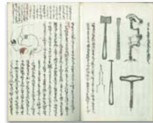
▲ 神戸医学校生徒の講義ノート 1885（明治18）年頃

大学文書史料室が所蔵する「特定歴史公文書等その他神戸大学の歴史に係る資料」は、2010（平成22）年3月廃止の百年史編集室から引き継いだ歴史公文書等約9,200件を中心に、創立以来の百有余年にわたり大切に継承された神戸大学及び前身諸学校の貴重な歴史公文書等、及び卒業生、退職教職員、同窓会、課外活動団体等から寄贈、寄託された本学の歩みを物語る各種の歴史資料など約50,000件で構成されています。これらは、温度・湿度が管理され防犯・防虫・紫外線除去等が配慮された専用書庫で大切に保存されています。