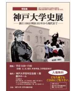
▲ 常設展の案内チラシ