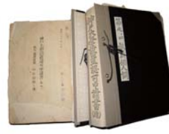
▲ 神戸大学設置認可申請書 1948（昭和23）年