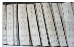
▲ 評議会記録 昭和30年代