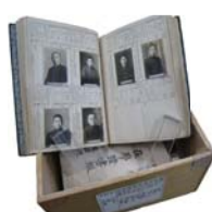
▲ 姫路高等学校 学籍簿 1933（昭和8）年 （利用制限あり）