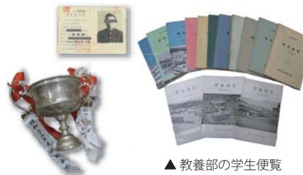
▲ 教養部の学生便覧