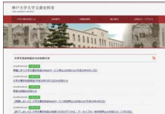
▲ 大学文書史料室ホームページ https://lib.kobe-u.ac.jp/archives/

卒業生・退職教職員の皆様へ 在学中・在職中の神戸大学に係る資料を ぜひ大学文書史料室にご寄贈ください。