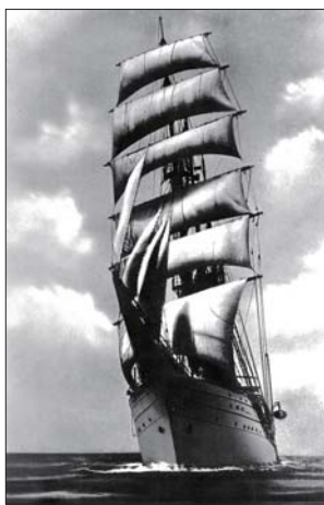
▲ 神戸高等商船学校の帆船練習船「進徳丸」 1923(大正12)年に三菱造船(株)神戸造船所において進水した。