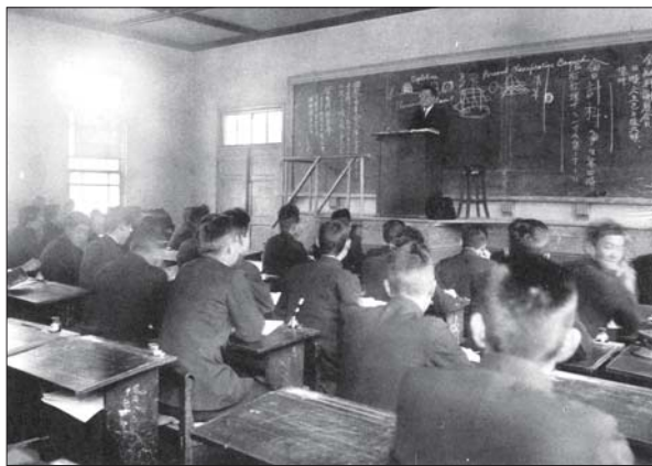
▲ 神戸高等商業学校の「経営学」講義風景 日本初の「経営学」講義が1926(大正15)年に開講、平井泰太郎教授が担当した。1926(大正15)年頃

100年前の大正時代にさかのぼり、当時の神戸大学の諸相について、貴重な歴史資料や写真などで振り返ります。皆様のご来場をお待ちしております。