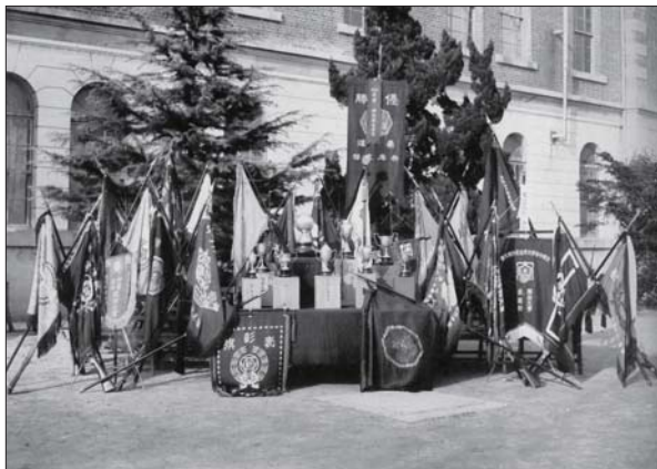
▲ 御影師範学校の優勝旗・優勝杯 御影師範学校は大正、昭和にわたり全国に名をとどろかす運動競技の名門校であった。1926(大正15)年頃