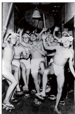
▲ 姫路高等学校「白陵寮」のストーム ストームは寮生による集団の大騒ぎ(嵐)でパンカラの一種。(昭和初期)