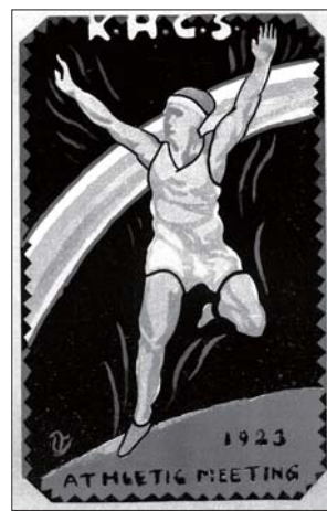
▲ 神戸高等商業学校「昇格祝賀記念陸上運動会」の絵はがき 大学昇格決定を記念して開催された(中山正實作)。1923(大正12)年