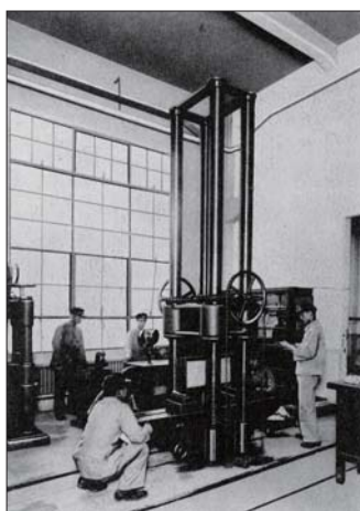
▲ 神戸高等工業学校のコンクリート試験機 1924(大正13)年頃に購入された(ドイツ製)。1935(昭和10)年頃