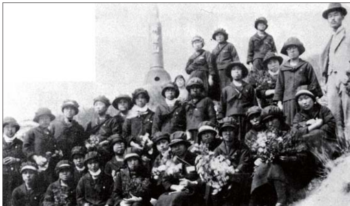
▲ 明石女子師範学校の「満鮮旅行」 明石女子師範学校では1924、25(大正13、14)年に「満鮮旅行」を実施。1924年に洋服の制服が制定され、手作りの制服を着ている。1925(大正14)年