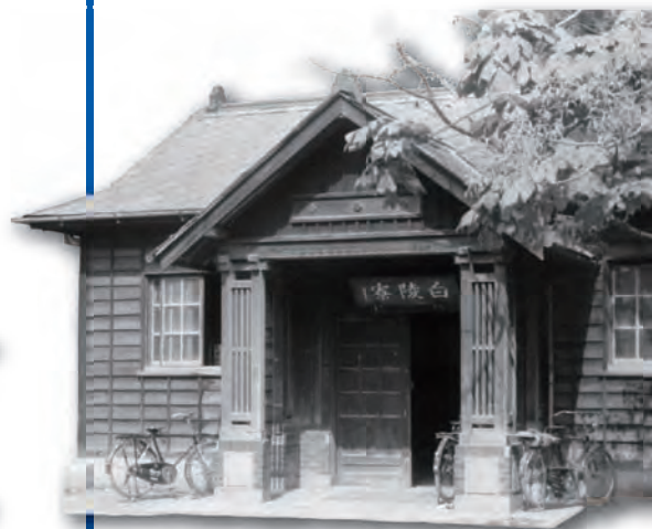
(右上) 阪急電鉄「六甲」駅 (1965 (昭和40) 年頃) (右下) 神戸大学姫路分校白陵寮 (1960 (昭和35) 年) (左上) 旧制神戸商業大学本館 (1937 (昭和12) 年頃) (左中) 神戸大学御影分校門標