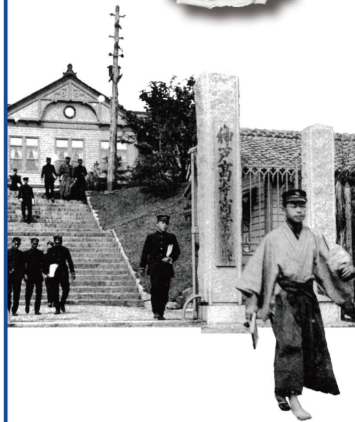
(右) 上から：神戸病院の建物(明治初期)／神戸病院のスタッフ(1917(大正6)年) ／神戸高等商業学校正門(1916(大正5)年頃)／(左) 神戸高等商船学校練習船「進徳丸」