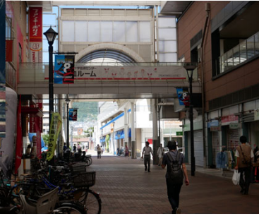
大正筋商店街(新長田) 上: 撮影: 和田幹司氏(1995/1/17) 右: 撮影: 神戸大学附属図書館(2024/9/11)