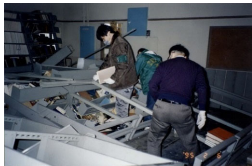
神戸商船大学附属図書館(現: 海事科学分館)

経験したことの無い大災害のなか、神戸大学ではどのような被害を被ったのか、また、学生や教職員はどのような対応に迫られたのでしょうか。被災時の神大の状況、学生の様子、ボランティア活動など、写真や記録などから紹介いたします。