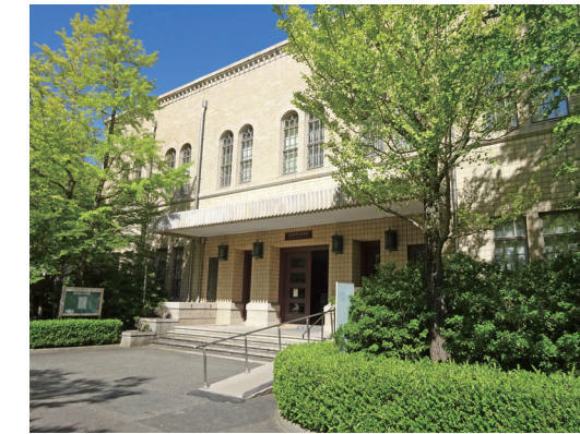
▲ 神戸大学附属図書館社会科学系図書館の正面玄関と本館2階天井のステンドグラス ステンドグラスには「KOBEL」・「UNIVERSITY」の文字が刻まれている 2023(令和5)年