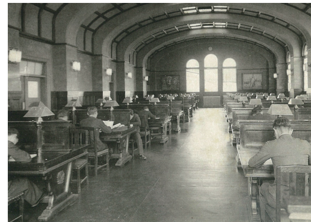
▲ 旧制神戸商業大学附属図書館2階「大閲覧室」1937(昭和12)年頃