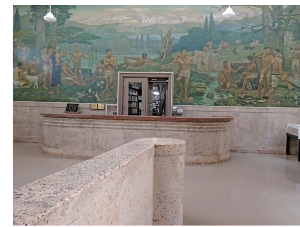
▲ 神戸大学附属図書館社会科学系図書館本館2階書庫入口(職員用)と大壁画「青春」 2023(令和5)年