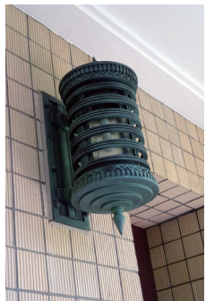
▲ 正面玄関外の照明 2023(令和5)年