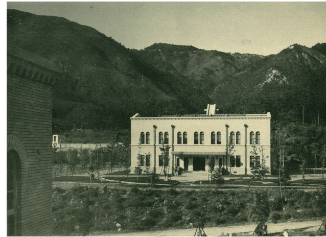
▲ 竣工まもなくの旧制神戸商業大学附属図書館の遠景 1937(昭和12)年頃

1949(昭和24)年新制神戸大学の誕生により、旧神戸経済大学附属図書館は、神戸大学附属図書館六甲台分館(法学部、経済学部、経営学部、経済経営研究所の図書館)に引き継がれた。附属図書館には当初4つの分館が設置されたが、六甲台分館は、学内最大の図書館施設と最大の蔵書数を誇る中心的存在であり、同年、同分館の建物内に中央図書館が設置された。1980(昭和55)年六甲台図書館と改称、1981(昭和56)年同館に管理棟が竣工、1984(昭和59)年同館と文学部図書館を統合して人文・社会科学系図書館が設置され、自然科学系図書館と共に2大中央図書館制(1992(平成4)年まで)が築かれた。1986(昭和61)年文部省から人文・社会科学系外国雑誌センターに指定されると、人文・社会科学系図書館の建物内に同センターが設置され、1995(平成7)