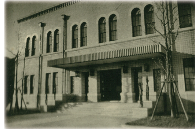
▲ 旧制神戸商業大学附属図書館の正面玄関 1939(昭和14)年頃