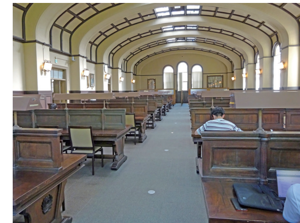
▲ 神戸大学附属図書館社会科学系図書館本館2階「大閲覧室」 2023(令和5)年