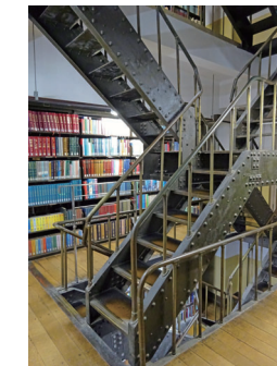
▲ 「書庫C棟」の重厚な階段と書架 2023(令和5)年