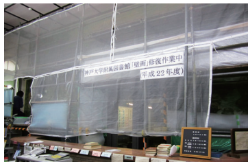
▲ 修復の様子 2011(平成23)年2月

まず、画面中央には、主軸となる2個のテーマが設定されている。上部には、 メインテーマ「理想」 を示す遙か遠くの高く清らかな雪の連峰が描かれており、その下には、雪の連峰を遠くから眺めて高さ理想に思いを馳せる青年と、折り倒されてもおお根元に新芽を吹く樹木が描かれ 「希望」 を示している。