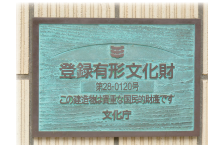
▲ 国の登録有形文化財となる 2003(平成15)年3月18日登録