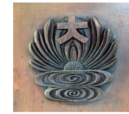
▲ 大閲覧室の閲覧机脚部の彫刻 2023(令和5)年