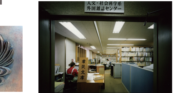
▲ 人文・社会科学系外国雑誌センターと震災文庫 2001(平成13)年頃