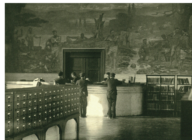
▲ 旧制神戸商業大学附属図書館2階出庫カウンターと大壁画「青春」 1939(昭和14)年頃

年兵庫県南部地震(阪神・淡路大震災)が発生し多数の犠牲者が出た際には、被災地の中心にある図書館の責務として貴重な震災資料の収集保存のため震災文庫(阪神・淡路大震災関係資料文庫)が、1999(平成11)年神戸大学電子図書館システム運用開始の際には電子情報掛(現・電子情報グループ電子図書館担当)がそれぞれ人文・社会科学系図書館の建物内に設置されるなど、本学附属図書館の軸であり続けた。