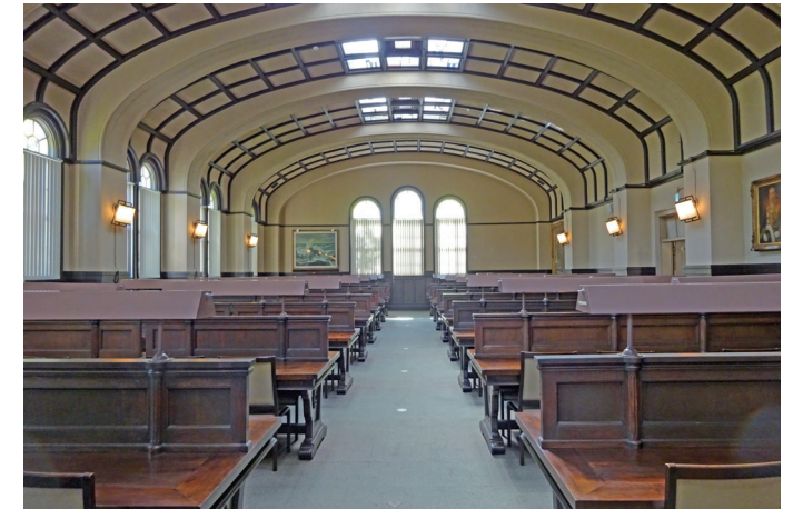
(左) 正面玄関 (右) 大閲覧室 2023(令和5)年9月