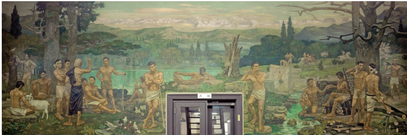
中山正實作、神戸大学附属図書館社会科学系図書館の大壁画「青春」 1935(昭和10)年10月完成(2008(平成20)年8月撮影)