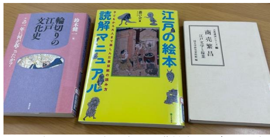
△展示されていた本の中で、職員さん一押しの本