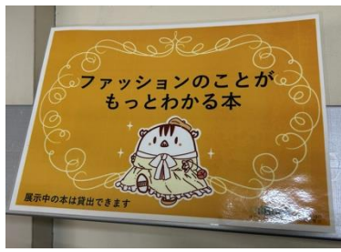
△人間科学図書館の展示紹介POP

実は人間科学図書館も結構幅広いジャンルの資料を所蔵しています。本当に多様な分野を研究されている先生がおられるので、テーマ展示を通して、「この図書館こういう本もあるんだ」という発見をしていただけると嬉しいです。