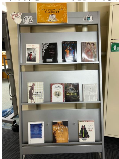
▽大きな什器とカラフルな書影が目を惹く

職員…展示器具の制約はありますが、ファッションを専門にしている本学の先生がお書きになった本はなるべく面出しするようにしています。しばらく面出しで置いておけるけれど動きがない時には、別の本に変えることもあります。