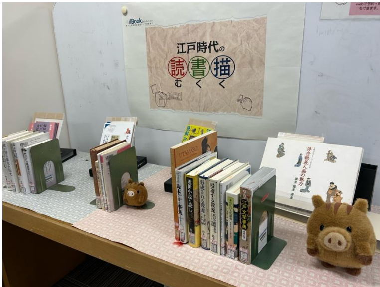
△人文科学図書館の展示コーナーではうりぼーがお出迎え

ULiCSが学生サポーターの目線から展示について気になることを職員さんにインタビューしてきました。第一弾は二館同時敢行！本と密接に関わる分野を支える人文科学図書館と、山上からの絶景が美しいだけじゃない人間科学図書館の、魅力が詰まった展示をご紹介します。