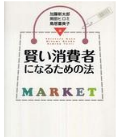
賢い消費者になるための法 加藤新太郎[ほか] 編 飯野由喜枝 [ほか] 著 弘文堂 2007.12