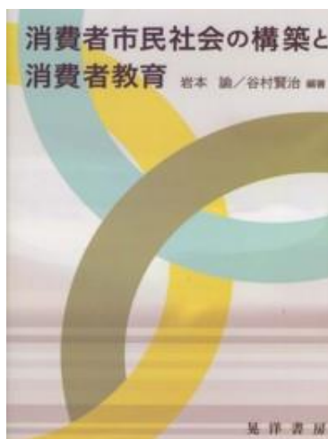
消費者市民社会の構築と 消費者教育 岩本諭，谷村賢治編著 晃洋書房 2013.7