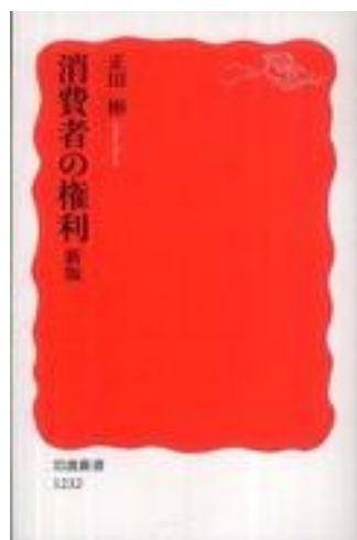
消費者の権利 新版 正田彬著 岩波書店 2010.2