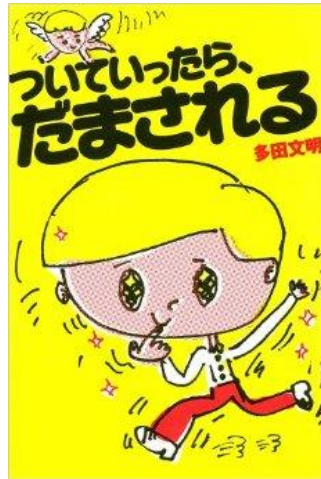
ついていいたら、だまされる 多田文明著 100%ORANGE, 及川賢治装画・挿画 イースト・プレス 2012.7