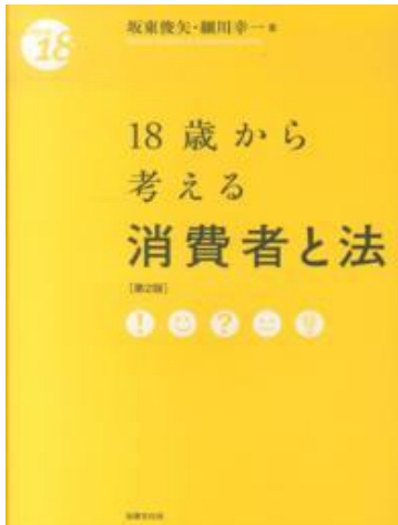
18歳から考える消費者と法 第2版 坂東俊矢，細川幸一著 法律文化社 2014.8