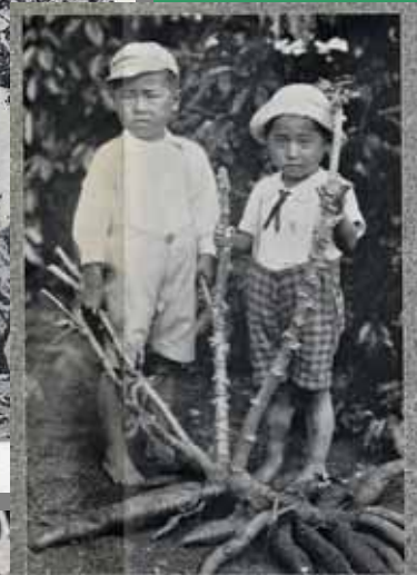
『南米ブラジル事情』より

住所: 神戸市灘区六甲台町2-1 (〒657-8501) 交通: 阪神御影・JR六甲道・阪急六甲の各駅より 市バス36系統 神大正門前下車約5分 問い合わせ先: 情報リテラシー係 電話: 078-803-5313