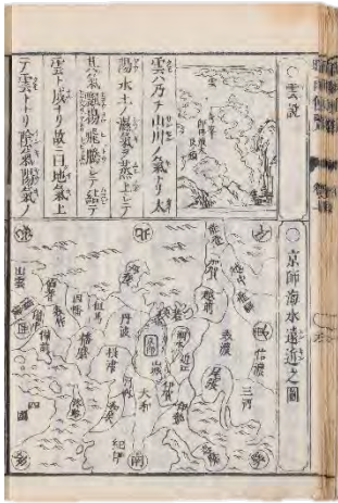
『増補民用晴雨便覧』

江戸時代、西洋文化は蘭学として日本に入ってきました。中でも八代将軍徳川吉宗は海外の知識や物産に高い関心を示し、享保5(1720)年に禁書令を緩和、これをきっかけに、自然科学分野の西洋書が翻訳され、出版されるようになりました。ここでは『解體新書』などの翻訳書を中心に、医学、天文学、農学など江戸時代の知識の広まりを資料から紹介します。