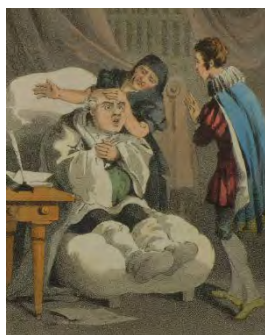
『The adventures of Gil Blas de Santillana』挿絵