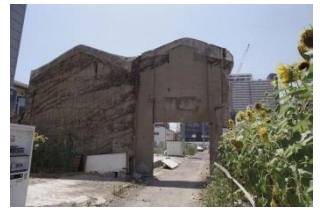
写真:神戸の壁