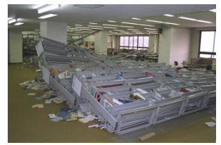
写真：国際・教養系図書室 の倒壊した書架