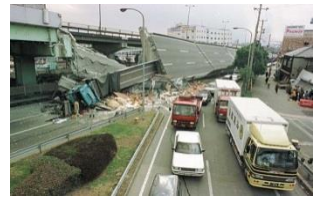
写真: 崩れた国道43号岩屋高架橋から落ちたトラック。