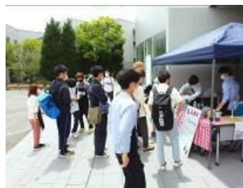
左から)アナウンス講習会、幼稚園訪問、図書館連携イベント